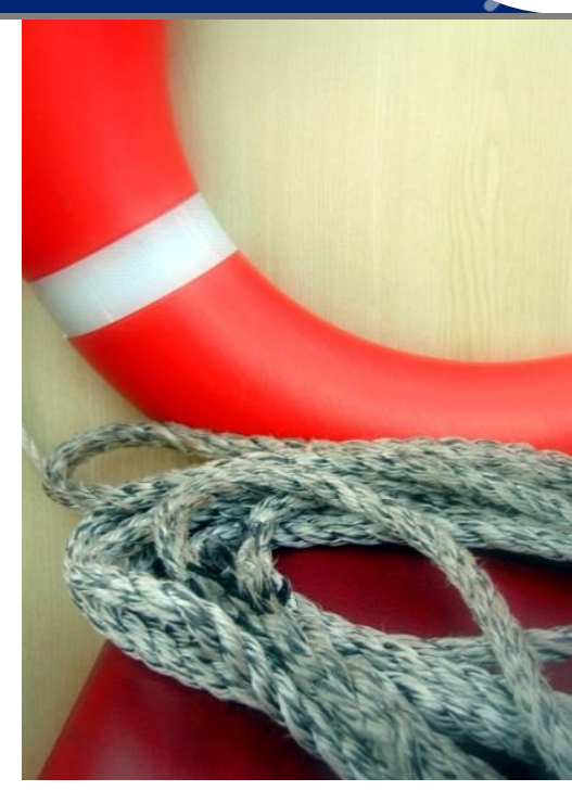
... with safety the best linkage.